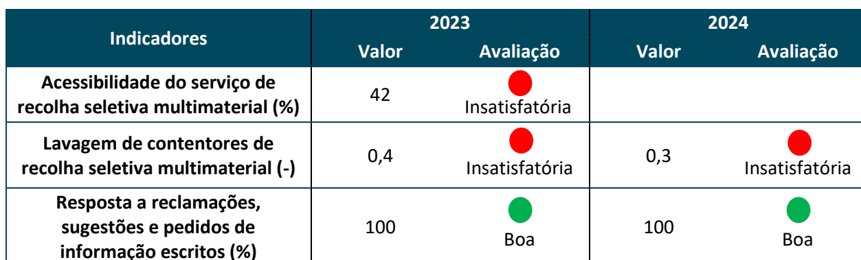
Tabela 1 - Indicadores de Qualidade de Serviço 2

Em 2024 foram registadas 143 reclamações sobre acumulação de resíduos urbanos na via pública junto aos equipamentos de deposição. A RESULIMA tomou as devidas medidas para regularizar a situação no prazo máximo previsto no RQS.